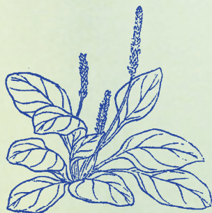
車前草：本品好生道邊及牛馬跡中，故有車前、當道、馬烏、牛遺諸名。

丹參 クワ アラ 味苦 メク ヲク ， 癰腫 ウツム 瘡疥 クハシ ， 生新 アム イラ 去惡 クハシ ， 祛除 クハシ 帶崩 ウツム 。 玄參 クワ アラ 甘苦 クワ ヲク ， 消腫 ウツム 排膿 クハシ ， 補肝 クハシ 益肺 クハシ ， 退熱 クハシ 除風 クハシ 。 牡丹 クワ アラ 苦寒 メク ヲク ， 破血 クハシ 通經 クハシ ， 血分 クハシ 有熱 クハシ ， 無汗 クハシ 骨蒸 クハシ 。 威靈 クワ アラ 苦溫 メク ヲク ， 腰膝 ウツム 冷痛 クハシ ， 消痰 ウツム 痲痺 クハシ ， 風濕 クハシ 皆用 クハシ 。 木瓜 クワ アラ 味酸 メク ヲク ， 溫腫 ウツム 腳氣 クハシ ， 霍亂 クハシ 轉筋 クハシ ， 足濕 クハシ 皆用 クハシ 。 地骨 クワ アラ 皮寒 メク ヲク ， 解肌 ウツム 退熱 クハシ ， 有汗 クハシ 骨蒸 クハシ ， 強陰 クハシ 涼血 クハシ 。 車前 クワ アラ 子寒 メク ヲク ， 溺澀 ウツム 眼赤 クハシ ， 小便 クハシ 能通 クハシ ， 大便 クハシ 能實 クハシ 。