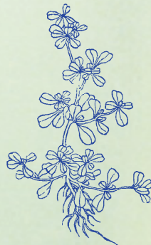
馬齒莧：本品葉序比竝如馬齒，而性滑利似莧，故名。