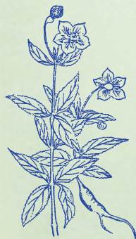
桔梗：本品根莖結實而梗直，故名。

桔梗 キ 味 ミ 苦 ク ， 療咽 リョウ 腫痛 シュウツウ ， 載藥 サイ 上 ジョウ 升 シヨウ ， 開胸 カイ 利 リ 壅 ウ 。