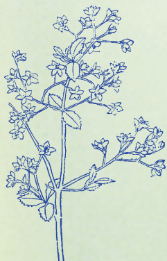
山茱萸：本經一名蜀酸棗，今人呼為肉棗，皆象形也。