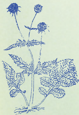
續斷：本品功能續折接骨，故名。

仙茅味辛，腰足攣痺，虛損勞傷，陽道興起。 棟子苦寒，膀胱疝氣，中濕傷寒，利水之劑。 萆薢甘苦，風寒濕痺，腰背冷痛，添精益氣。 寄生甘苦，腰痛頑麻，續筋壯骨，風濕尤佳。 續斷味辛，接骨續筋，跌撲折損，且固遺精。 龍骨味甘，夢遺精泄，崩帶腸癰，驚癩風熱。 人之頭髮，補陰甚捷，吐衄血暈，風驚癩熱。