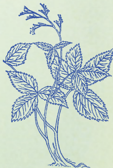
當歸：本品功能調氣養血，使氣血各有所歸。