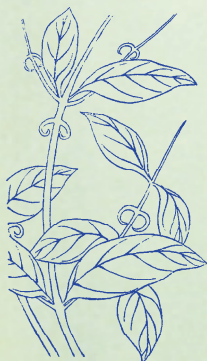
鉤藤：本品刺曲如鉤，故名。