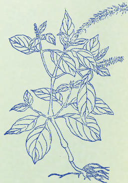
牛膝：本品莖有節，似牛膝，故名。