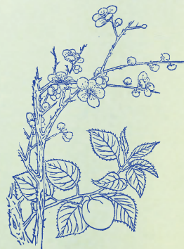
梅：落葉喬木，早春未長葉，先聚樹而開花。花露、實、仁等均能療疾。