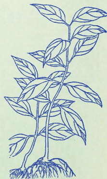
升麻：本品莖葉如麻而性上升，故名。