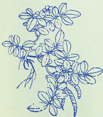
決明：本品功能明目，故名。