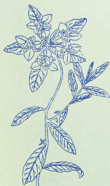
大戟：本品味極辛苦，載人咽喉，故名大戟。

葶藶辛苦，利水消腫，痰咳積癥，治喘肺癰。 牽牛苦寒，利水消腫，蠱脹痰癖，散滯除壅。 海藻鹹寒，消癭散癥，除脹破結，利水通閉。 商陸苦寒，赤白各異，赤者消風，白利水氣。 芫花寒苦，能消脹蠱，利水瀉濕，止咳痰吐。 大戟苦寒，消水利便，腹脹症堅，其功瞑眩。 甘遂苦寒，破症消痰，面浮腫脹，利水能安。