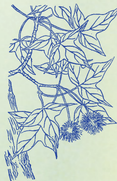
楓：灌木。香脂顆粒小如芝麻、大如小豆，嚼之似蠟，味苦。