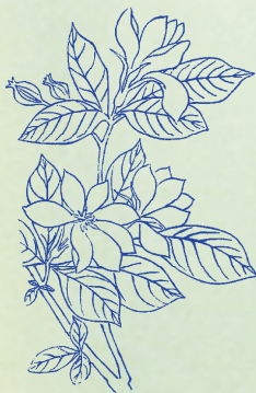
梔子：卮者，酒器也。本品子實形象似之，故名。

連翹 カク 苦寒 クハ ， 能消癰毒 シユウ ， 氣聚血凝 キク ， 溫熱甚逐 ニホ 。 梔子 シ 性寒 セツ ， 解鬱除煩 ゲツ ， 吐衄胃痛 トク ， 火降小便利 カク 。 黃柏 ワウ 苦寒 クハ ， 降火滋陰 カク ， 骨蒸濕熱 クツ ， 下血堪任 カク 。 黃芩 ワウ 苦寒 クハ ， 枯瀉肺火 コ ， 子清大腸 シ ， 濕熱皆可 カク 。 黃連 ワウ 味苦 ミ ， 瀉心除痞 ゲツ ， 清熱明眸 シユ ， 厚腸止瀉 カク 。 天門 テン 甘寒 カン ， 能治肺癰 ニホ ， 消痰止嗽 シユ ， 喘氣有功 カク 。 麥門 マク 甘寒 カン ， 解渴祛煩 ゲツ ， 補心清肺 ホク ， 虛熱自安 カク 。