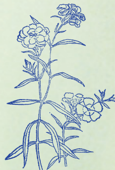
瞿麥：本品之子頗似麥子，故名。

蘇木 ソモク 甘鹹 カンケン ，能行積血 ノウコウシツケツ ，產後血經 サンゴトケツ ，兼醫撲跌 ケンイハクテツ 。