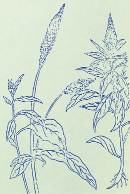
青葙子：一名草決明，以治目疾，鄉人皆知。