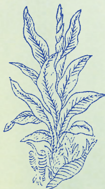
鬱金：本品根形似莖 筴，而醫馬病，故名 馬筴。又能解肺金之 鬱，遂名鬱金。

白芨 フカヒ 味苦 ク ， 功專收斂 クツクツ ， 腫毒瘡瘍 クツクツ ， 外科最善 クツクツ 。 白藜 フカヒ 味苦 ク ， 療瘡瘙癢 クツクツ ， 白癩頭瘡 フカヒ ， 翳除目朗 フカヒ 。 漏蘆 カヌ 性寒 サム ， 祛惡瘡毒 クツクツ ， 補血排膿 クツクツ ， 生肌長肉 カヌ 。 金銀花 ヒラ 味甘 ミ ， 療癰無對 カヌ ， 未成則散 カヌ ， 已成則潰 カヌ 。 鬱金 ヒラ 味苦 ク ， 破血行氣 カヌ ， 血淋尿血 カヌ ， 鬱結能舒 ヒラ 。 薑黃 ヒラ 味辛 ミ ， 消癰破血 カヌ ， 心腹結痛 カヌ ， 下氣最捷 ヒラ 。 桃仁 ヒラ 甘平 ミ ， 能潤大腸 カヌ ， 通經破瘀 カヌ ， 血瘀堪嘗 ヒラ 。