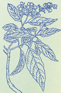
大青：本品莖葉色皆深青，可以染色，而有大小之別，故名。