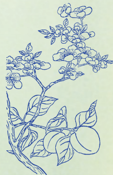
杏：杏字篆文象子在木枝之形。核中之仁可以入藥。