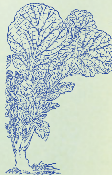
芥菜：氣味辛烈，菜中之介然者，食之有剛介之象，故字從介而名曰芥。