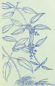
茜草：茜者，西也。本品東方有而少，不如西方多，故名。

預知子貴， 綴衣領中， 遇毒聲作， 誅盡殺蟲。 茜草味苦， 蠱毒吐血， 經帶崩漏， 損傷虛熱。 骨碎補溫， 折傷骨節， 風雪積痛， 最能破血。 狗脊味甘， 酒蒸入劑， 腰背膝痛， 風寒濕痹。 金屑味甘， 善安魂魄， 癲狂驚癇， 調和血脈。 銀屑味辛， 謔語恍惚， 定志養神， 鎮心明目。 黑鉛味甘， 止嘔反胃， 鬼疰癭瘤， 安神定志。