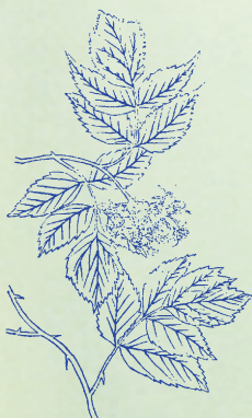
覆盆子：子似覆盆之形，故名。