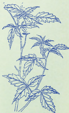
常山：本品苗名蜀漆，根名常山。