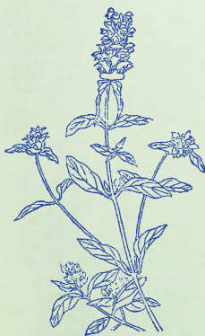
夏枯草：本品夏至後即枯，故名。

夏枯草苦，療癰癭瘤，破症散結，濕痹能療。 鬼箭羽苦，通經活絡，驅邪止痛，殺蟲祛結。 射干味苦，逐瘀通經，喉痹口臭，癰毒堪憑。 枇杷葉苦，偏理肺臟，吐噦不已，解酒清上。 大小薊苦，消腫破血，吐衄咯唾，崩漏可啜。 茅根味甘，通關逐瘀，止吐衄血，客熱可去。 青蒿氣寒，治瘧效好，虛熱盜汗，除骨蒸勞。