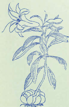
百合：本品之根由眾瓣合成，故名。