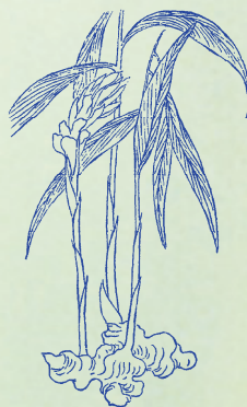
乾薑：乾薑肉色淨白，故有白薑、均薑之名。