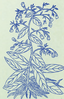
紫草：本品花紫根紫，可以染紫，故名。