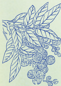
龍眼：形象龍目，故名。