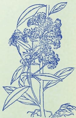
白頭翁：本品近根處有白茸，狀如白頭老翁，故名。