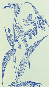
薏苡：一年生草本，白花褐實，其仁類麥粒而狹長，內部白色，嚙之如糯米。