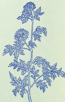
蛇牀：蛇虺喜臥於下，食其子，故有蛇牀、虺牀、蛇粟諸名。

蛇蛻 ヘビテウ 辟惡 ヒクアク ，能除翳膜 ニクニクニク ，腸痔蟲毒 ニクニクニク ，驚癰搐搦 シヤクニクニク 。