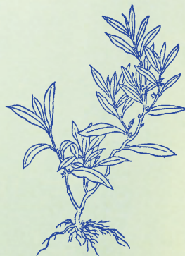
篇蓄：多繁殖路旁，其根強韌，青花黑實。俗稱殘竹草，牛喜啖之。