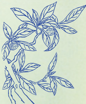
枳實：枳乃木名，實乃其子，故名。