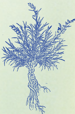
遠志：本品功能益智強志，故有遠志之稱。