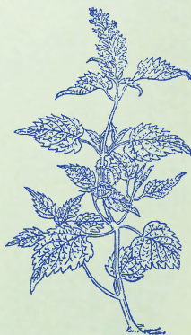
藿香：豆葉曰藿，本品葉似之而氣香，故名。

木通 モクツウ 性 セイ 寒 カン ，小 シユウ 腸 テウ 熱 ネツ 閉 ヘイ ，利 リ 竅 キョウ 通 ツウ 經 キョウ ，最 サイ 能 ノ 導 ドウ 滯 シユ 。